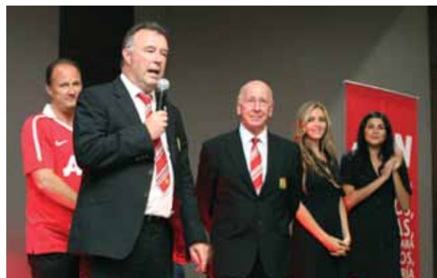
Al partido asistió Sir Bobby Charlton, figura esencial en el Manchester United

La nueva casa del equipo Guadalajara, el estadio de fútbol Omnilife, fue el marco para un encuentro entre dos clásicos del balón, uno a nivel internacional y otro nacional.