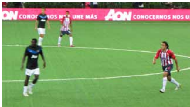
El Manchester United es reconocido en mercados en los que Aon busca fortalecerse, como Asia, Medio Oriente y Latinoamérica.

Ganar el liderazgo y conservarlo exige contar con una marca confiable. Asociarla con un líder que ofrece el espacio más valorado en el mercado deportivo es una excelente estrategia para fortalecer nuestras metas de crecimiento y la visión global de Aon.