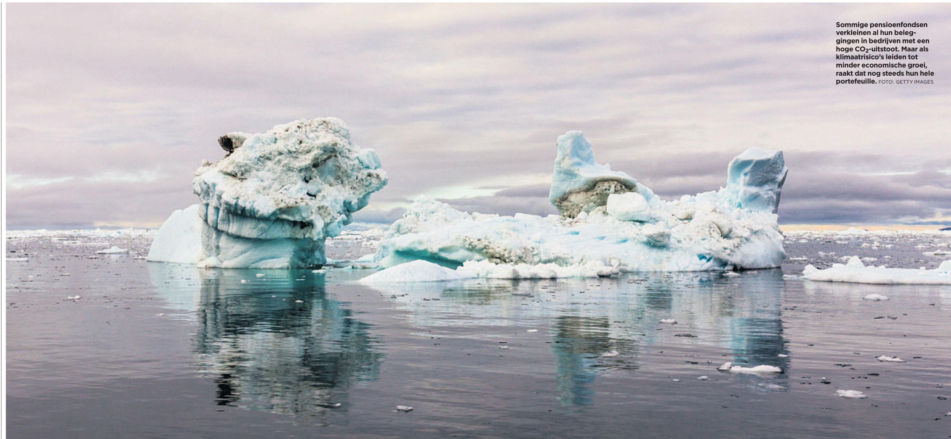
Sommige pensioenfondsen verkleinen al hun beleggingen in bedrijven met een hoge CO 2 -uitstoot. Maar als klimaatrisico's leiden tot minder economische groei, raakt dat nog steeds hun hele portefeuille.

'In het slechtste geval daalt de dekkinggraad van een pensioenfonds met ruim 30% ten opzichte van het basisscenario', zegt Reedijk. In dat scenario zet klimaatverandering door, en resulteert die in grote economische schokken en recessie. Als er iets eerder — over een jaar of